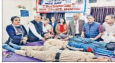
भिवानी। रक्तदाताओं को बेज लगाते हुए।